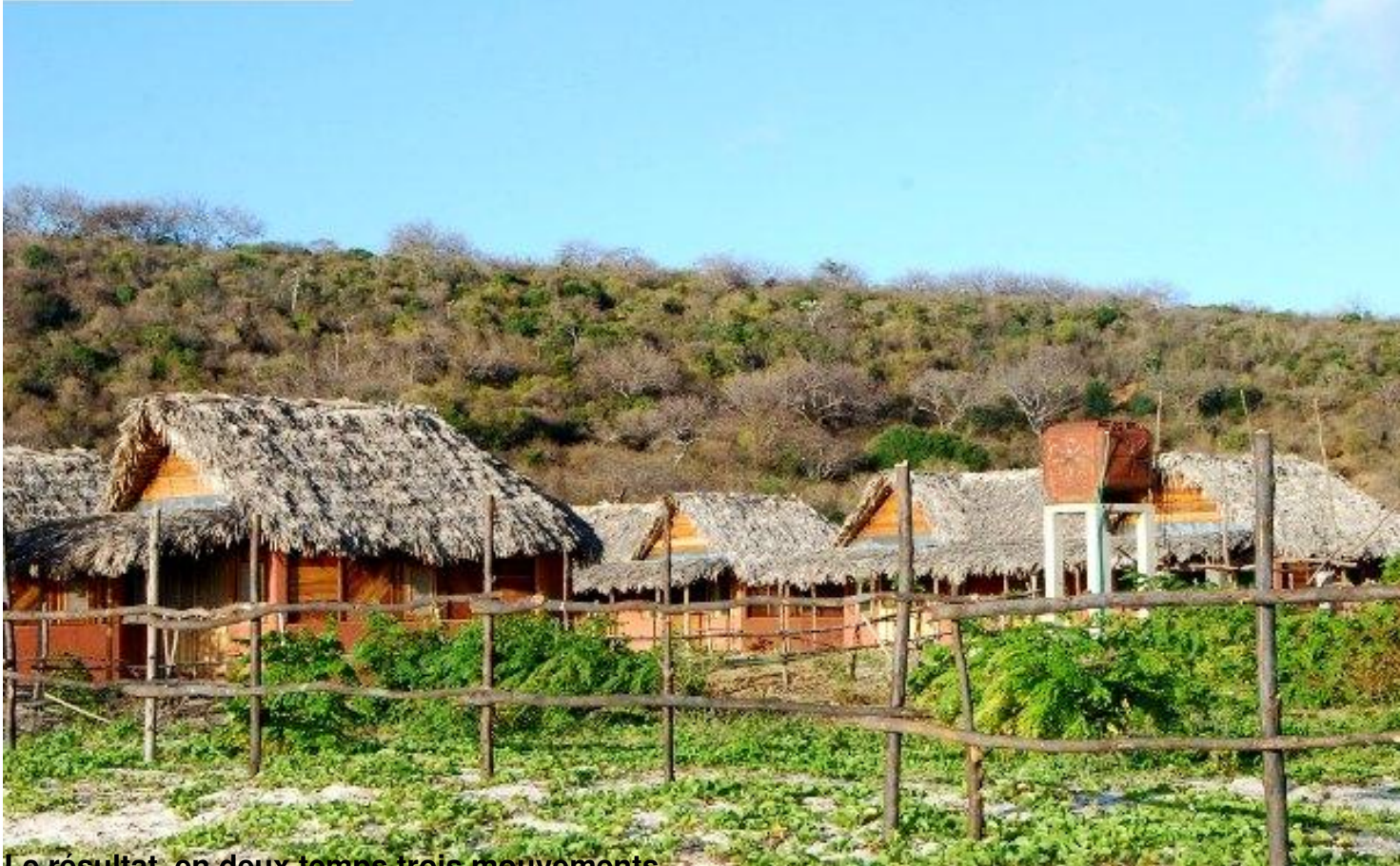
Le résultat, en deux temps trois mouvements...