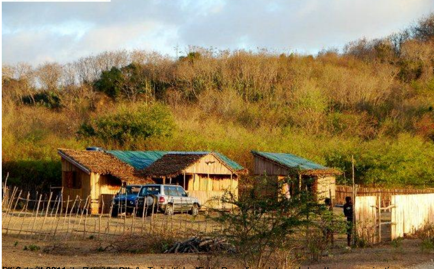
10 août 2011, site Fénasua. C'est la présence des Américains à Orangea, sur ce camp dans la région d'Orangea.