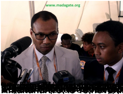
Le président de la Commission nationale électorale (CNE) a annoncé le retrait des mandataires du n° 13 du comptage des voix à la CENI.