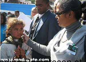
Nacason et une enfant retrouvée