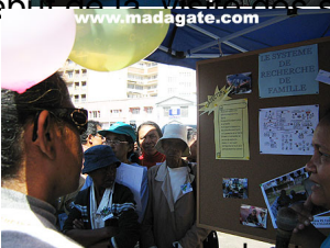
Comment chercher les enfants ?