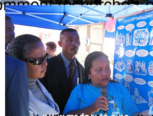
Ma discipline de travail et les résultats obtenus par elle