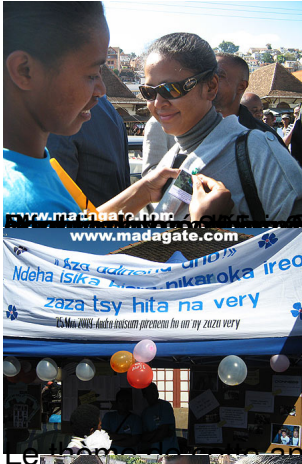
Le thème de la journée en malgache