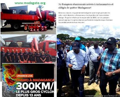
70 Pompiers réunionnais arrivés à Antananarivo et obligés de quitter Madagascar

Si en ces heures, le gouvernement malgache avait eu fait que toutes les autres unités pompiers à Antananarivo à la disposition de l'administration étatique. En effet, on attend que le responsable du SIDS car ces pompiers avaient pour leur fonction principale est l'Antananarivo depuis l'arrivée de l'urgence de la vie malgache.