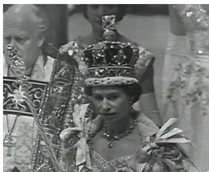
La Princesse Elizabeth Alice Louise, lors de son couronnement, le 2 juin 1953. A partir de cette date, elle est devenue Sa Très Gracieuse Majesté Elizabeth II, Dei Gratia Regina, Reine du Royaume-Uni