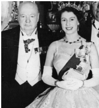
Ny Praiminisitra Winston Churchill sy ny Mpanjakavavy Elizabeth II, tamin'ny Fivorlamba ara-economikan'ny Commonwealth Economic Conference notontosaina tao amin'ny Buckingham Palace ny taona 1952

Nandritra ny 70 taona nanjakan'ny Mpanjavavy Elizabeth II, dia nanokatra isan-taona ny fotoam-pivoriana isan-taonan'ny Parlemanta (in-telo monja izy no tsy afaka nanao izany). Hetsika ofisialy manetriketrika nisy efa an-jato taona izy io. Ao anatin'izany dia nipetraka teo amin'ny seza fiandrianany ny Mpanjakavavy Elizabeth II ary namaky tamin'ny feony malefaka ny fandaharan'asan'ireo mpanao lalànan'ny governemanta. Marihina fa tsy izy Manjakavavy mihitsy no namolavola izany lalàna izany.