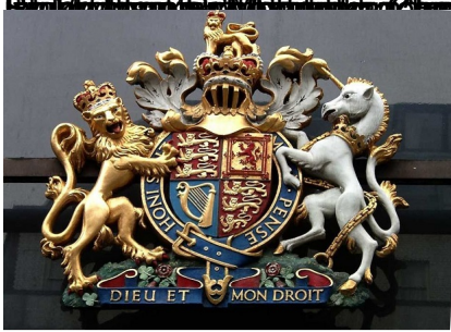
Nodimandry ny Alakamisy 8 Septambra 2022, teo amin'ny faha 96 taonany ny Mpanjakavavy Elisabeth II tao amin'ny trano fonesany tsary Balmoral, Ecosse. Fomba inay hafa noho izany, ny "Opération Unicorn" na "Opération Licorne", izay harahina ao anatin'ny folo andro ho avy. Ny Licorne (hoavaly fotsiny misy tandroka tokana matanitra) dia mariky ny Ecosse ary mitongadina amin'ny akajony-dry zarco Ecosais, miaraka amin'ny lona anglisy, io ambonny io ny "blason" an'ny Royaume-Uni.