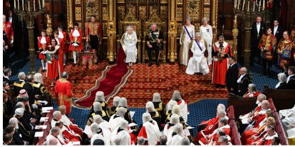
State Opening of Parliament | The Royal Family

nanomboka ny taona 1708. Fa tsy tambo isaina ireo fanendrena ofisialy nekeny (fa tsy nataoko eto ireo).