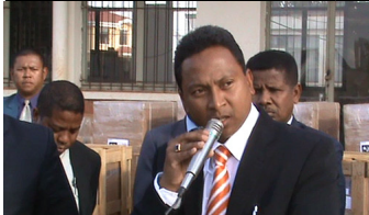
At the end of the day, the General Director of the Ministry of Energy