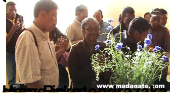
photographe, suivi d'une collègue de la RNM pour couvrir ce