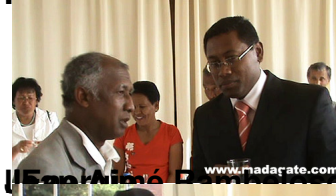
n, de la TVM, à gauche, interviewant le Dir cteur Cab du ministère de