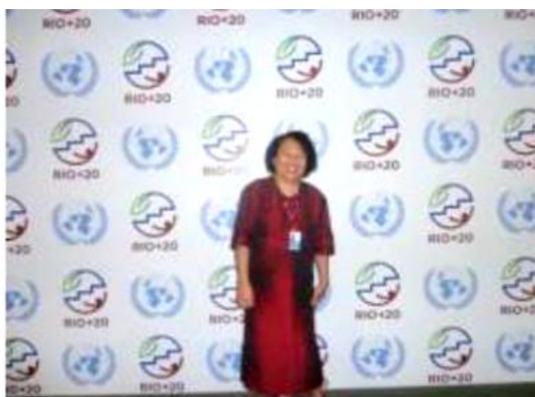
Le Chef de Service de la Communication Environnementale