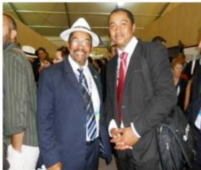
Le Ministre du Tourisme et son conseiller Technique / Le Ministre du Tourisme un des panélistes

Éléments de la participation de Madagascar à la Conférence Rio+20