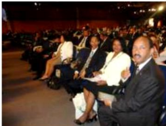
Monsieur Le Point Focal National (PFN) du Développement Durable, Mr le SG du MAE et certains conseillers

Éléments de la participation de Madagascar à la Conférence Rio+20