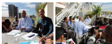
Mr le SECRÉTAIRE GÉNÉRAL du MEF, en tant que chef de file de l'équipe du MEF à dirigé la Mission technique de briefing de la Délégation malgache le 19 juin 2012 à Rio de Janeiro.

participants étaient inscrits y compris le secteur privé et la société civile. Près de 130 Chefs d'Etat et de Gouvernement (dont 79 Chefs d'Etat) ont fait le déplacement à Rio. La Conférence s'est également distinguée par le nombre des activités et réunions. En effet, outre les réunions officielles, environ 500 événements en marge se sont tenus dans le Centre de Conférence et 3000 dans la ville de Rio dont le Sommet du peuple.