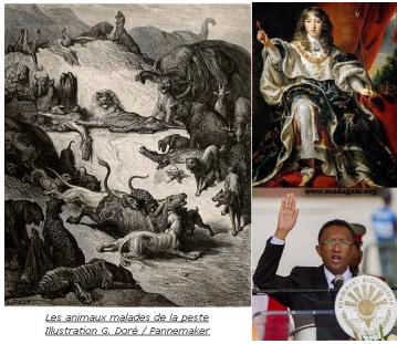
Les animaux malades de la peste Illustration G. Borel / Fainemalac

Cette épidémie de peste qui sévit actuellement à Madagascar me ramène à plus de 40 ans en arrière, au temps où j'étais lycéen et à l'époque où l'on étudiait les fables de Jean de La Fontaine dans la Grande île. Un passé à jamais révolu mais qui nous permet, à nous, derniers survivants de l'avant mai 1972, de rester philosophes face à des situations que l'on croyait ne plus jamais se reproduire. Hélas, avec le comportement indigne du candidat n° 3, une fois qu'il a été élu président de la république -il y a 4 ans-, c'est la régression totale pour tout un peuple, avec, en prime, le grave danger de devenir des étrangers dans leur propre pays.