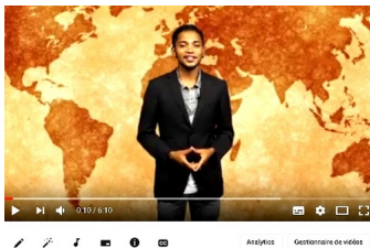
LE RENDEZ VOUS Tsy Mahaleo ny Sampona N°01 08 Juillet 2017

Le succès du numéro un de l'émission « Tsy mahaleo ny sampona » , produite par le MLE est incontestable, il suffit pour preuve de voir le nombre important d'internautes qui ont vu la vidéo et qui l'ont positivement commentée.