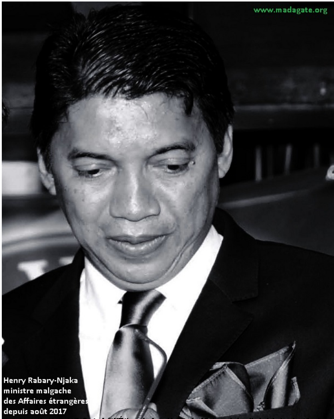
Henry Rabary-Njaka ministre malgache des Affaires étrangères depuis août 2017