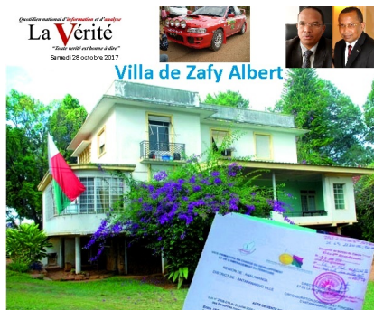
Les preuves et les acteurs de la vente photo-montage: www.madagate.org