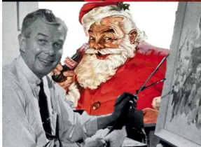
L'illustrateur Haddon Sundblom et le personnage de Santa Claus qu'il a dessiné pour faire la publicité de Coca Cola.