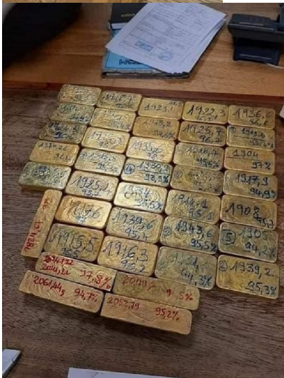
La forme et l'aspect artisanal des lingots découverts à Johannesburg.

Pour penser à des trucs artistiques chinois... STAG