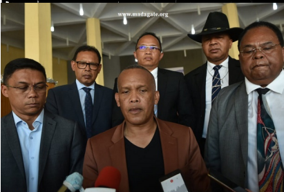
MJE Anjo, 7 janvier 2021. Tous les ministres concernés se sont engouffrés d'aller au-devant de la presse.