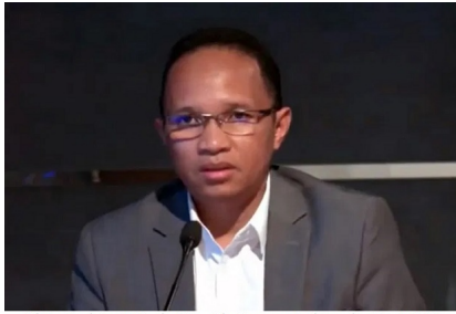
Fidiniavo Ravokatra, Ministre des Mines et des Ressources stratégiques depuis janvier 2019

Parce que le Président de la République a donné des ordres pour que l'affaire des 73,5 kg d'or en lingots artisanaux aboutisse à des résultats et que des coupables soient trouvés -« n'iza n'iza » -,