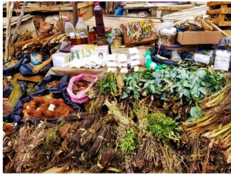
« Raokandro malagasy » – Plantes médicinales.

Dans le chapitre 7 de son livre intitulé « Du soin au rite dans l'enfance » (Editions Erès, 2007), l'ethnologue Sophie Blanchy nous apprend que la racine du mot malagasy