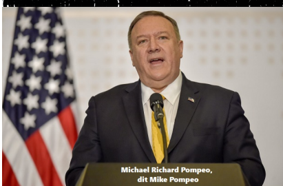
Michael Richard Pompeo, dit Mike Pompeo

DEPARTMENT OF STATE [Public Notice 11252] In the Matter of the Designation of the Eastern Turkistan Islamic Movement Also Known as ETIM as a "Terrorist Organization" Pursuant to Section 212(a)(3)(B)(v)(II) of the Immigration and Nationality Act, as Amended Acting under the authority of Section 212(a)(3)(B)(v)(II) if the INA, as amended, I hereby revoke the designation of the Eastern Turkistan Islamic Movement, also known as ETIM, as a "terrorist organization" under Section 212(a)(3)(B)(v)(II) if the INA. This determination shall be published in the Federal Register. Dated: October 20, 2020. Michael R. Pompeo, Secretary of State.