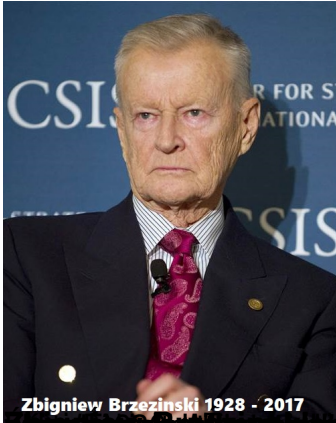
Zbigniew Brzezinski 1928 - 2017