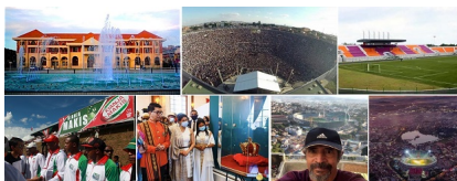
Exemples concrets d'infrastructures réalisées ou planifiées au Grand Sud : Stade de Mahamasina Antananarivo ; Stade manarapenitra de Barikadimy à Toamasina ; Coliseum d'Antsonjombe ; Palais de la Reine du Roava de Manjakamiadana ; Hôtel de ville d'Antananarivo ; stade Makis d'Andohatopenaka

de cette partie de l'île, grâce au projet « Ceinture Verte » visant à lutter contre la désertification et à appuyer la résilience au changement climatique. « C'est une promesse solennelle que je fais aujourd'hui afin de sortir le Grand Sud de la pauvreté. C'est grâce à cet engagement inédit, aux efforts communs que nous allons changer le destin du Grand Sud de Madagascar » , a déclaré le Président Andry Rajoelina.