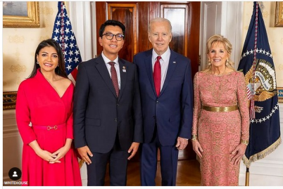
Mialy et Andry Rajoelina avec Joe et Jill Biden, à la Maison-Blanche en décembre 2022