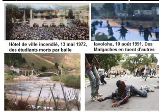
Hôtel de ville incendié, 13 mai 1972, des étudiants morts par balle Iavoloha, 10 août 1991. Des Malgaches en tuent d'autres Fathita. Pont dynamité dans la nuit du 28 au 29 mars 2002 Ambohitsorohitra, 7 février 2009. Carriage sans sommation