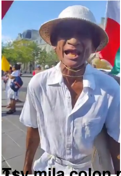
Tsy mila color ny firenena malagasy !