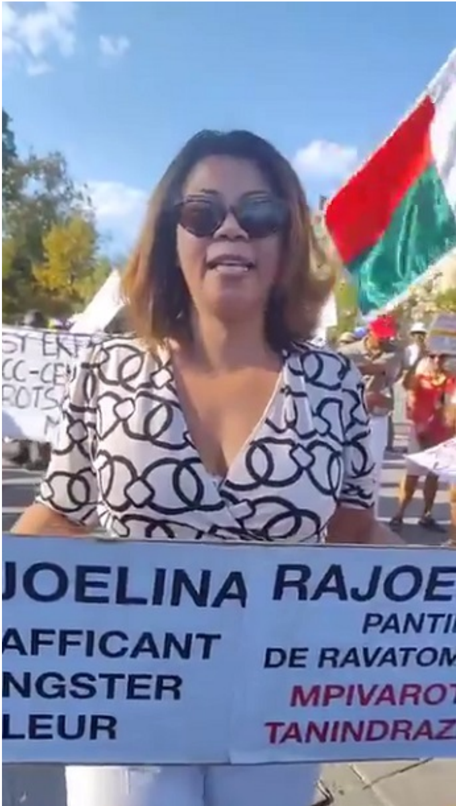
Ity saka ny fiidatana izany Anahy Rajoelina natao ny leharan'ny Malagasy ity Hcc izany