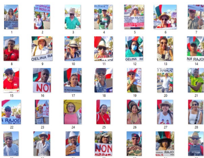
« Fivondronamben'ny Malagasy manohitra ny jadona » ao France taritria'ny GTT 2009