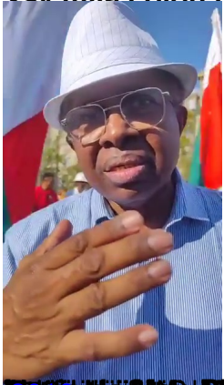
Tena Malagasy ka ny hafa hainoizany.