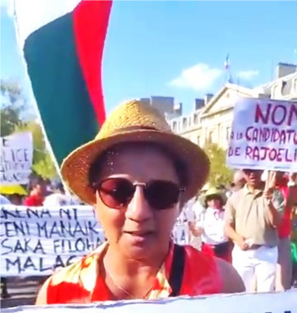
Rajolainha.: miala ianao tsisy atakandro, ianao sy ny forongonao ireo. Mijaly ny vahoaka, maty