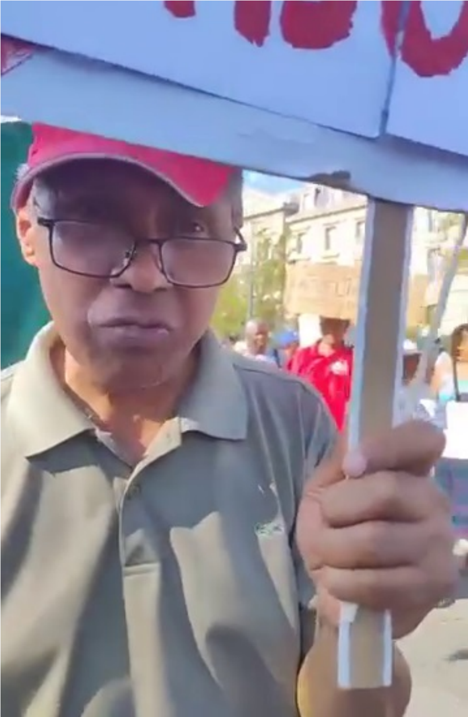
Olona iray hafa Antanimonika mbelantsa Fanabe. Mba hantsa raipe jany aza. Mis aotra