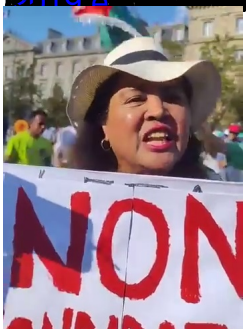
Rano-belo an'idey ireo heu... Rajoelina... (inaudible) tena mandehan mi-dégage, mandehana