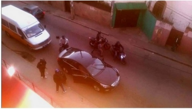
Photo prise à partir d'une fenêtre de la villa Pradon