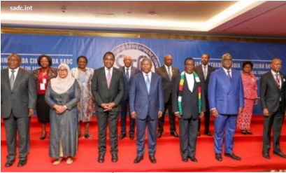
Photo de famille des Chefs d'État et de gouvernement de la Communauté de développement de l'Afrique australe (SADC), à l'issue de la Réunion extraordinaire du Sommet de cette entité, qui a eu à Luanda (République

Dossier Historique pour le rapport RALIMBAQAS 15 de ce 09 novembre 2023