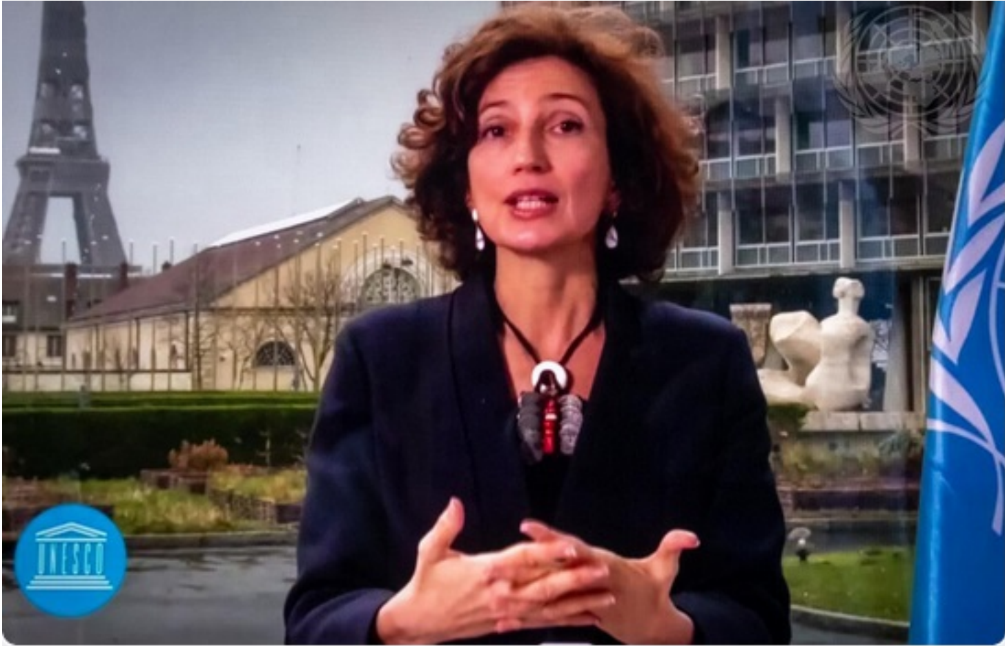
Audrey Azouley, Directrice générale de l'UNESCO