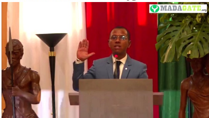
Mahatante Tsimanaoraty Paubert, ministre de la Pêche et de l'Economie bleue