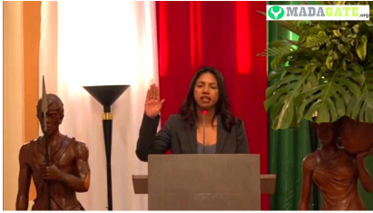
Lalotiana Rakotondrazafy, ministre de l'Enseignement technique et de la Formation professionnelle