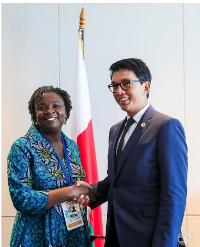
Addis-Abeba, Ethiopia, 18 Febroary 2023, Fivoriana an-tampony tsotra faha-37 ho an'ireo Filoham-pirenena sy Filoham-panjakana ao amin'ny Firaisam-be Afrikana na "Union africaine" (UA). Fihonana fanintelonny teo amin'ny Filoha Andry Rajoelina sy Ramatoa Victoria Kwakwa, Filoha lefitry ny Banky iraisam-pirenena ho an'ny faritra Atsinanana sy Atsimon'ny Afrika.

ny faharoa tany Dar-es-Salaam, Tanzanie, ny 26 Jolay 2023,