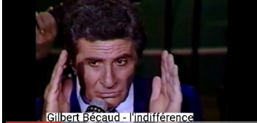
Gilbert Bécaud - Indifférence

Centre de formation de l'Union des pasteurs de Madagascar - 2016 (présenté par le point