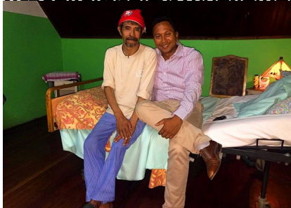
dimanche à Paris, se sont pressés dans l'air Si Augustin est juif de BA le 12 07, avec dala