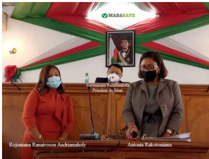
Liste définitive des candidats retenus à l'élection des représentants du Sénat pour devenir membres de la HCC durant un mandat de 7 ans