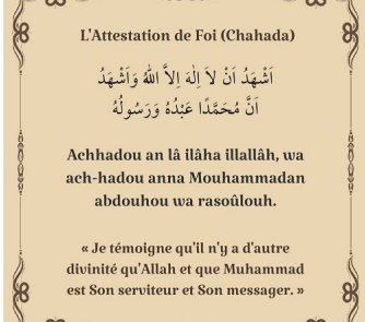
IL HAMA DA ne croire qu'il n'y a pas d'autre Dieu hormis Allah qui est le Seul et l'Unique et