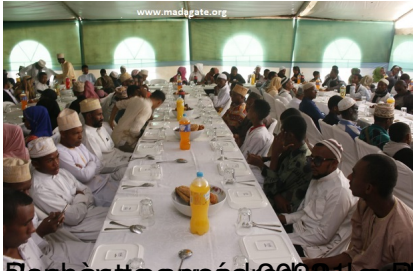
Rebentice vendredi 2009 - La Namadae 2023 la nuit de l'Aid el-Fitr le Vendredi 22 mars au soir et