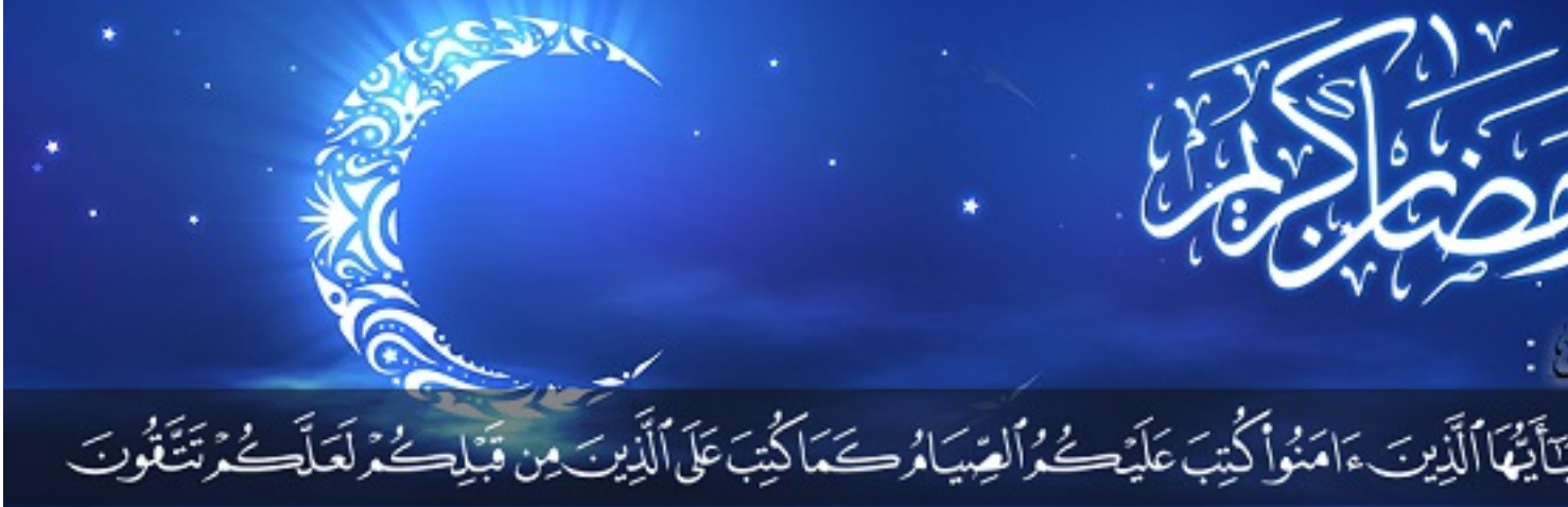
SAJIM ou SWAM : Jeûner de l'aube jusqu'au crépuscule pendant le Ramadan.