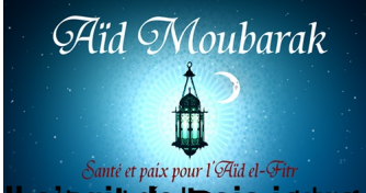
l'islam de l'union des musulmans de Madagascar et de la Réunion. Les musulmans se réunissent pour prier