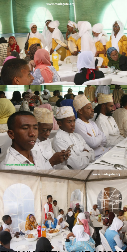
Le Mois Sacré du Ramadan 2023, à Antananarivo lors de la nuit de célébration