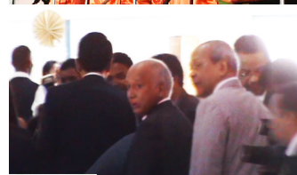
8 janvier 2010 - Palais d'Etat d'Iavoloha