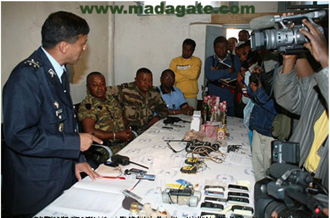
Le général Ramanantsoa Andriamandisoa, à gauche, lors d'une conférence de presse à l'issue de la réunion de travail à la base de l'armée à Antananarivo, le 25 juin 2009.