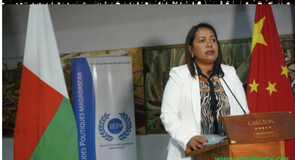
Ramatoa Lantsoa Rakotomalala, ministry ny Industria sy ny Varotra