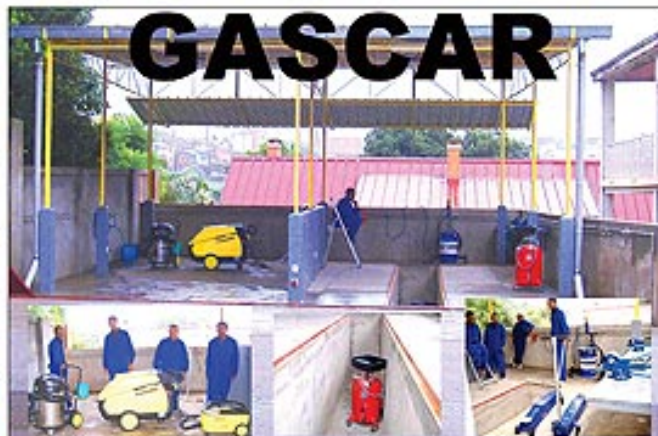
Professionnalisme - Qualité - Haute technologie - Rapidité