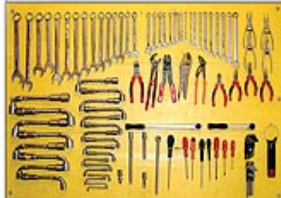
Le professionnalisme, chez GASCAR, c'est une place pour chaque outil et chaque outil à sa place