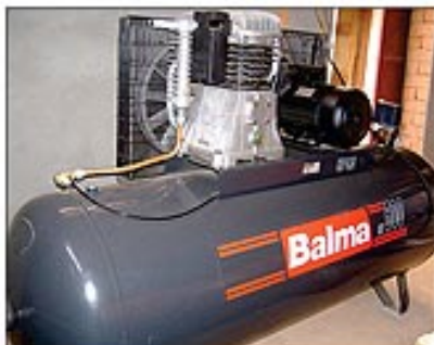
Deux Compresseurs Haute Technologie de 500 litres chacun