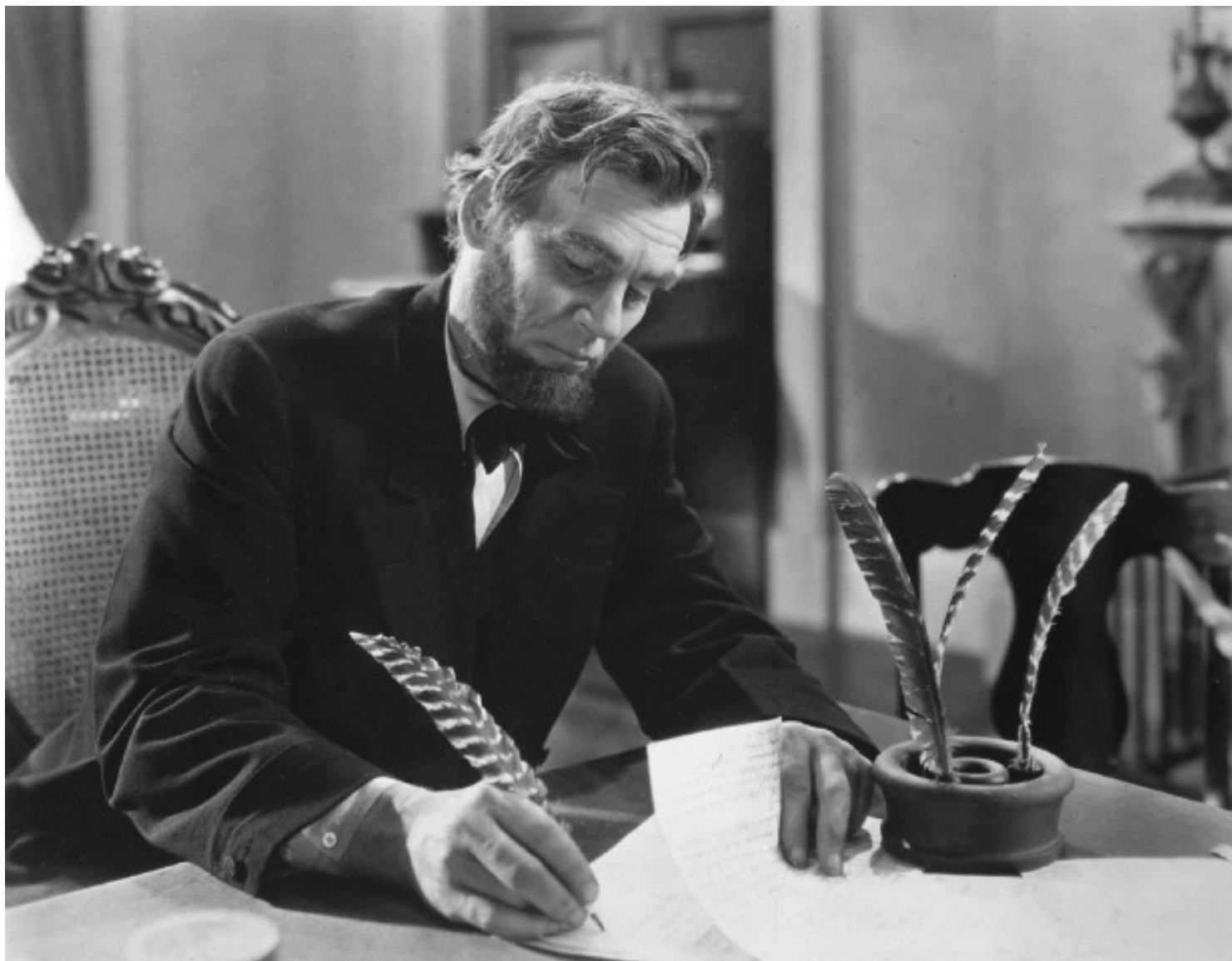
Abraham Lincoln joué par l'acteur Walter Huston dans le film « Abraham Lincoln »