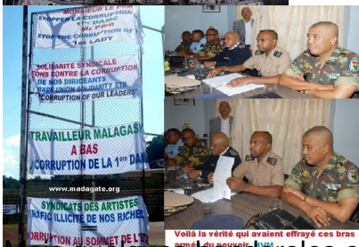
Voilà la vérité qui avaient effrayé ces bras