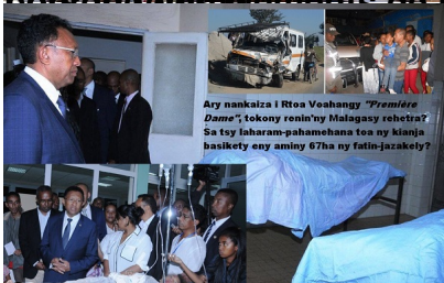
Ary nankaiza i Rtoa Voahangy "Première Dame", lokony renin'ny Malagasy rehetra? Sa tsy isararam-pahamehana ton ny kianja hasikety eny aminy 67ha ny fatin-jazakety?

est un des plus grands défis de la justice en République, à qui les droits de