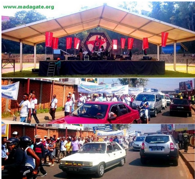
Kianja monisipalin'Alarobia, 01 Mey 2016