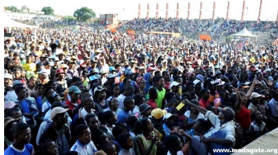
Stade d'Alarobia, Antananarivo, 1er mai 2016