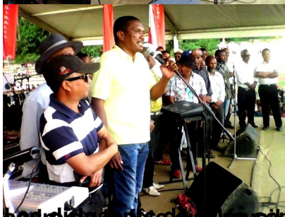
de l'Union nationale (UN) initiateurs de cette vidéo dans le