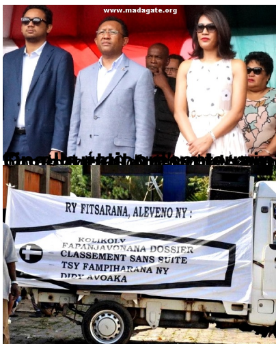
de la loi de l'Union nationale (UN) lors de