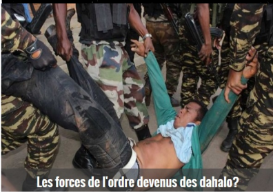
Les forces de l'ordre devenus des dahalo?