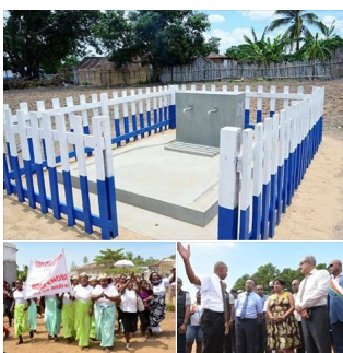
7 décembre 2015, Morafenobe, région Melaky. Inauguration présidentielle d'une borne fontaine aux couleurs Hvm

l'Etat jouera le rôle de facilitateur et assurera la sécurité des biens et des personnes mais surtout celle des investissements ».