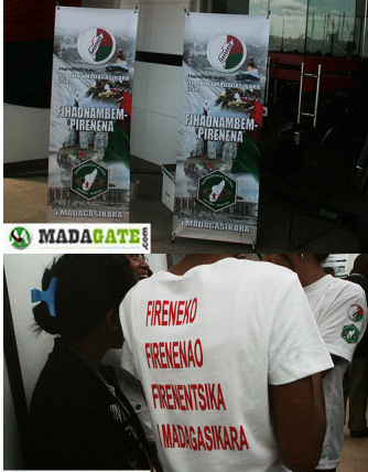
Madagascar est ma patrie, ta patrie, notre patrie