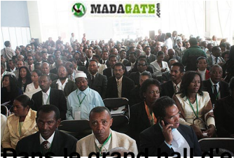
Présentation de la conférence