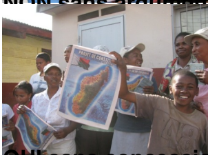
NON sans concession