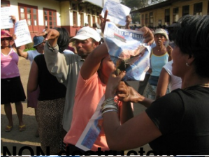
NON à la corruption