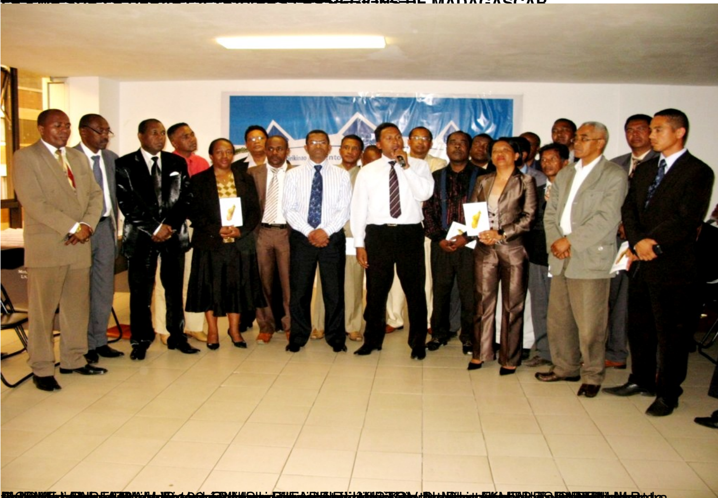
ELABORATION D'UN PROJET DE LOI CONCERNANT LE NIVEAU D'IMPOT SUR LE REVENU DES PARTICULIERS A MADAGASCAR