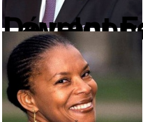
Christiane Taubira , ministre de la Justice, Garde des sceaux