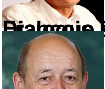
Jean-Yves Le Drian