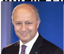
Laurent Fabius , ministre des Affaires étrangères et du