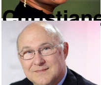
Michel Sapin , ministre des Finances et des Comptes publics