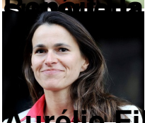
Aurélie Filippetti , ministre de la Culture et de la communication