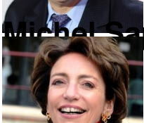
Marisol Touraine , ministre des Affaires sociales