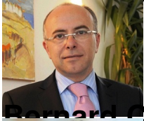
Bernard Cazeneuve , ministre de l'Intérieur