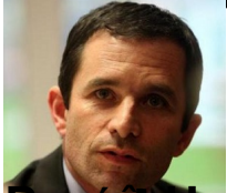
Benoît Hamon , ministre de l'Education nationale, Enseignement