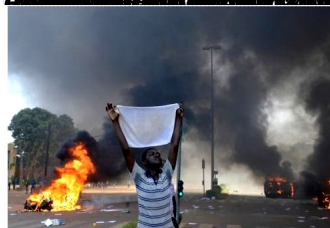
Quelques images du 30 octobre 2014. Un manifestant brandit un drapeau blanc au-dessus de sa tête.