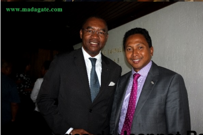
reportages de Jeannot Ramambazafy et Harilala Randrianarison