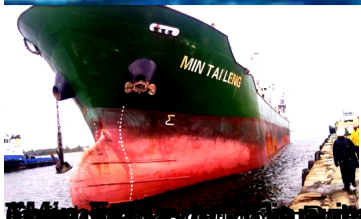
Bolabola, le bois qui saigne

LE MONDE | 24.01.2015 à 11h24 • Mis à jour le 26.01.2015 à 10h19 | Par Laurence Carrel (envoyée spéciale à Madagascar et Xinyuan (Chine))