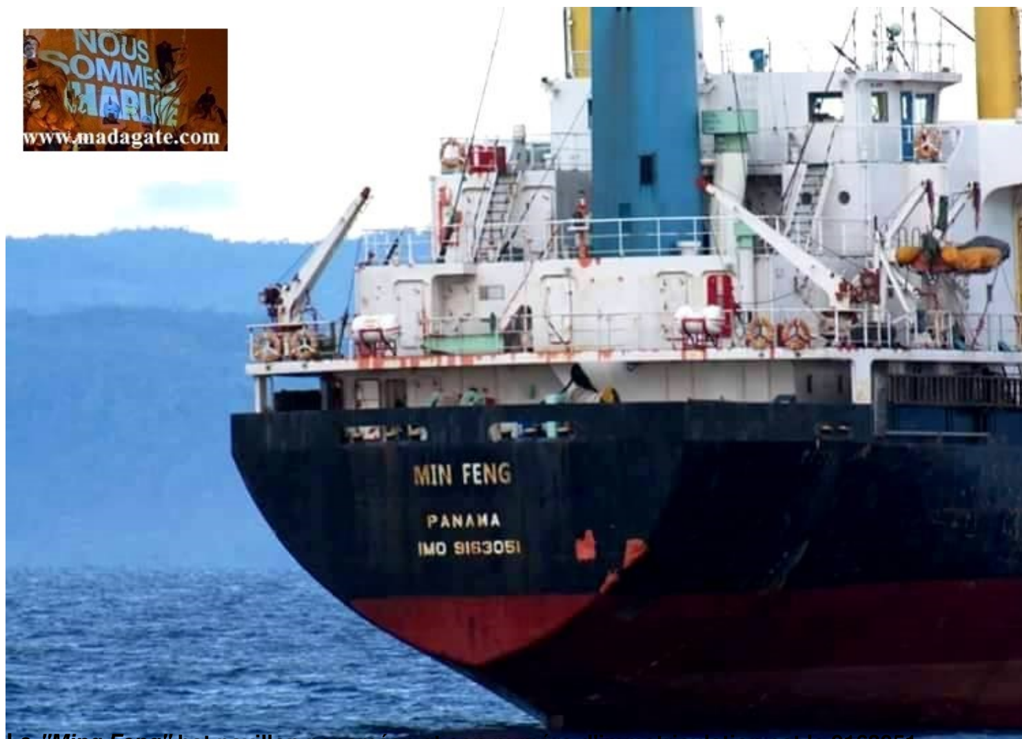
Le " Ming Feng " bat pavillon panaméen et son numéro d'immatriculation est le 9163051