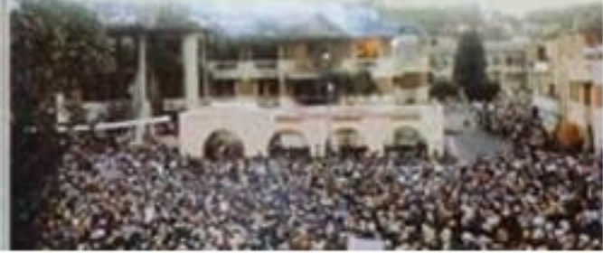
Hôtel de ville incendié, 13 mai 1972, des étudiants morts par balle

Et pour la réalité les événements idéologiques internes d'inspiration en