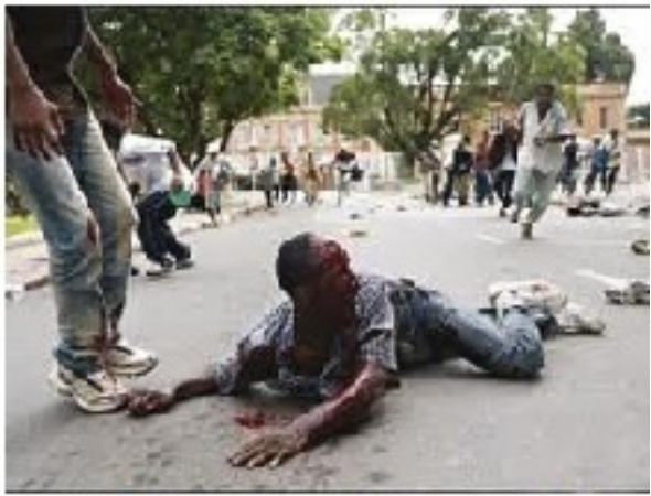
Ambohitsorohitra, 7 février 2009. Carnage sans sommation

Commentaire présenté la suite ?... L'Histoire n'étant pas statique, il y aura une suite, COMMUNIQUÉ 7 février 2015 www.madagafiq.com Le Président de la République, H.E. Andriamananjato RAOANARIMAMPANINA, a tenu une conférence de presse à l'Assemblée Nationale, le 7 février 2015, à 15 heures, pour présenter les orientations de sa politique de réconciliation nationale et de reconstruction de l'Etat. Le Président a souligné que la réconciliation nationale est un processus qui doit être conduit de manière inclusive, transparente et participative, impliquant toutes les parties prenantes de la société malgache. Il a également souligné que la reconstruction de l'Etat est une priorité absolue pour le Gouvernement, et que le processus de réconciliation nationale est indissociable de ce processus de reconstruction. Le Président a conclu sa conférence de presse en déclarant que le Gouvernement est déterminé à mener à bien ce processus de réconciliation nationale et de reconstruction de l'Etat, afin de garantir la stabilité, la paix et le développement durable de Madagascar.