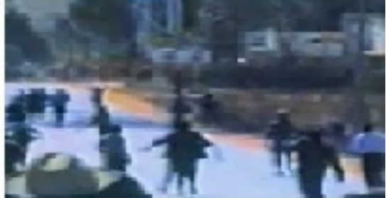
Iavoloha, 10 août 1991. Des Malgaches en tuent d'autres