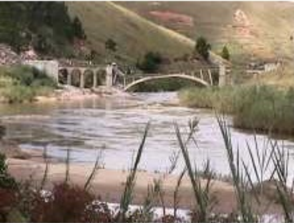
Fatihita. Pont dynamité dans la nuit du 28 au 29 mars 2002