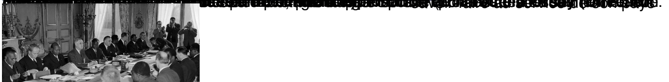
February 03, 1959. First Session Of The Executive Council Of The Community, From Left To Right, Philibert Tsiranana, Head Of The Malagasy Government, Antoine Pinay Minister For Finance, Leon M'ba, Prime Minister Of The Autonomous Republic Of Gabon, President Charles De Gaulle.