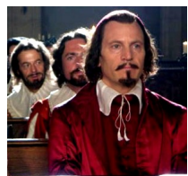
Tchéky Karyo en Cardinal de Richelieu