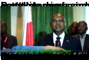
Le Premier ministre Hery Rajaonarimampianina lors d'une conférence de presse.