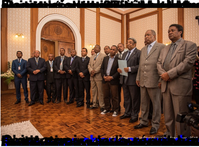
Le Premier ministre Hery Rajaonarimampianina et ses collaborateurs lors d'une conférence de presse.