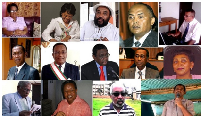
14 des 33 membres du CFM (Conseil du Fampihavanana Malagasy) au 25 août 2017 www.madagaste.org