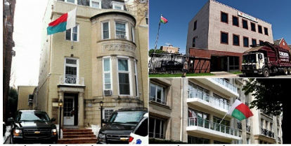
Ambassades de Madagascar aux Etats-Unis, au Canada et en France

sur cette réouverture de l'ambassade de Madagascar. Ce, pour que le président Hery Rajaonarimampianina évite de s'embarquer dans un nouveau mensonge au peuple malgache qui paie tous ses voyages.