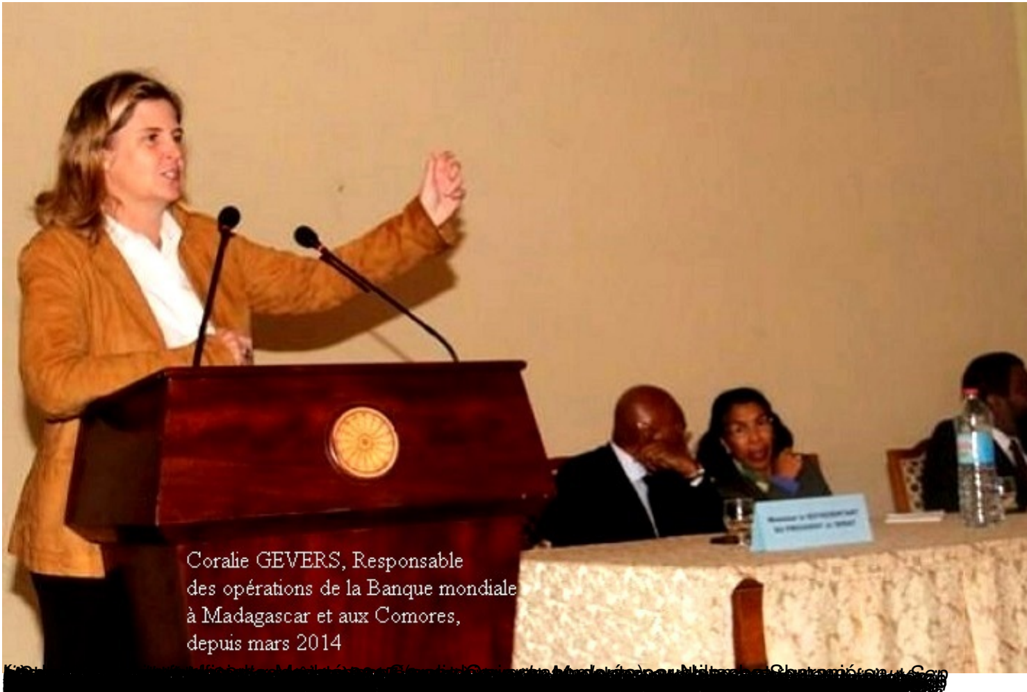
Coralie GEVERS, Responsable des opérations de la Banque mondiale à Madagascar et aux Comores, depuis mars 2014